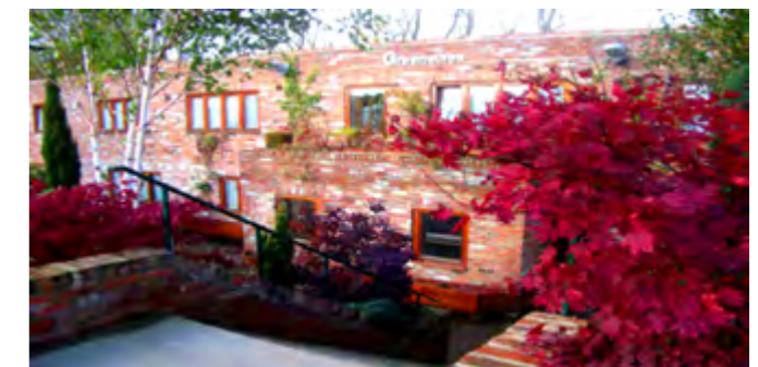
Alojamiento para los estudiantes

Por eso hemos seleccionado minuciosamente el alojamiento para los más jóvenes. En Queen Ethelburga's College los estudiantes tendrán acceso a zonas totalmente amuebladas donde podrán socializarse y hacer amigos de todo el mundo después de sus clases de inglés.